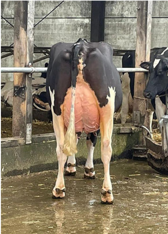
HAH IWANKA DAM