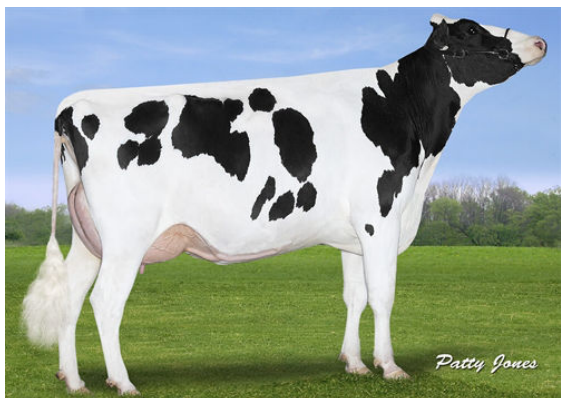
MS-FARNEAR-MICA-MARGARITA- FOURTH DAM