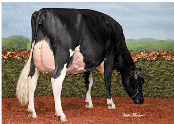
SILVERMAPLE DAMION CAMOMILE THIRD DAM