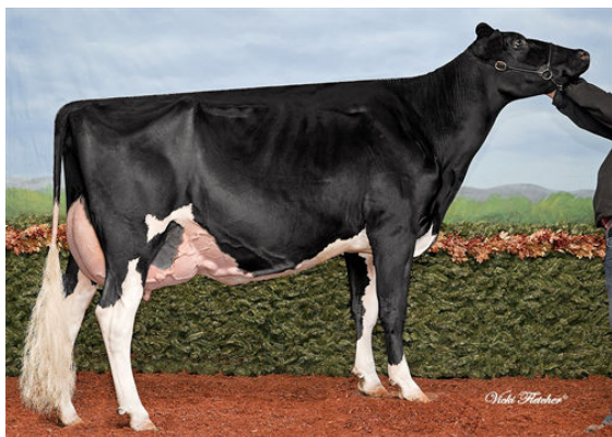
SILVERMAPLE DAMION CAMOMILE THIRD DAM