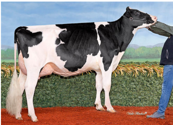
DREWHOLME LAMBDA LEYSURE P