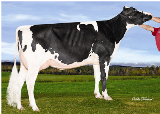
DULET ARMSTEAD KIM 1 FOURTH DAM