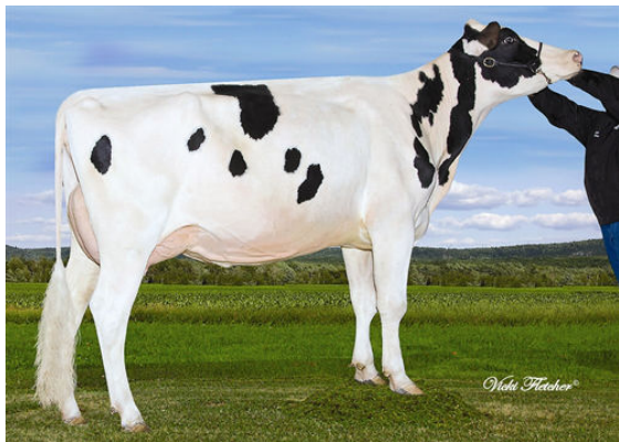
DULET BOLTON KIRPA FIFTH DAM