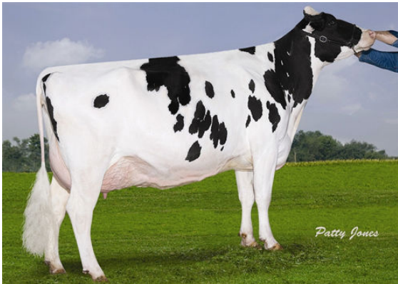
BOSDALE OUTSIDE PORTRAIT FOURTH DAM