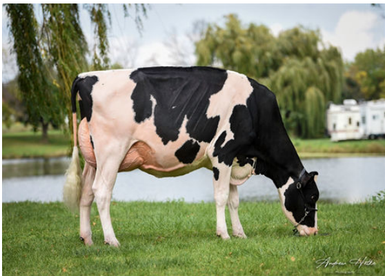
LADYROSE CAUGHT YOUR EYE DAM