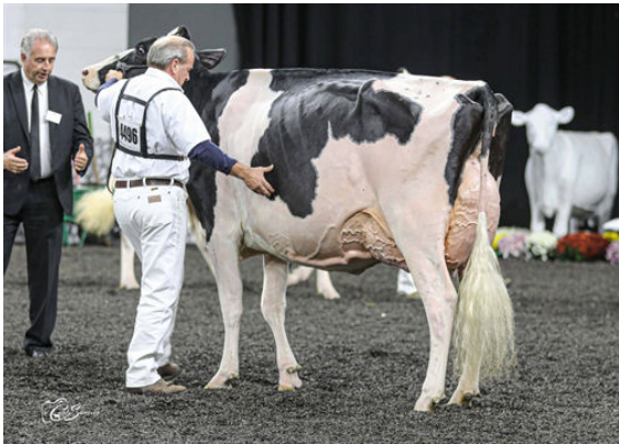
LADYROSE CAUGHT YOUR EYE DAM