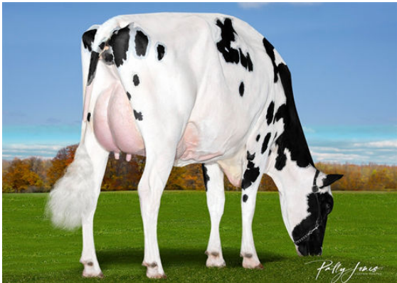
VOGUE REDEYE LOVE AFFAIR-P DAUGHTER