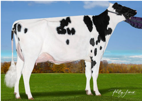
VOGUE REDEYE LOVE AFFAIR-P DAUGHTER