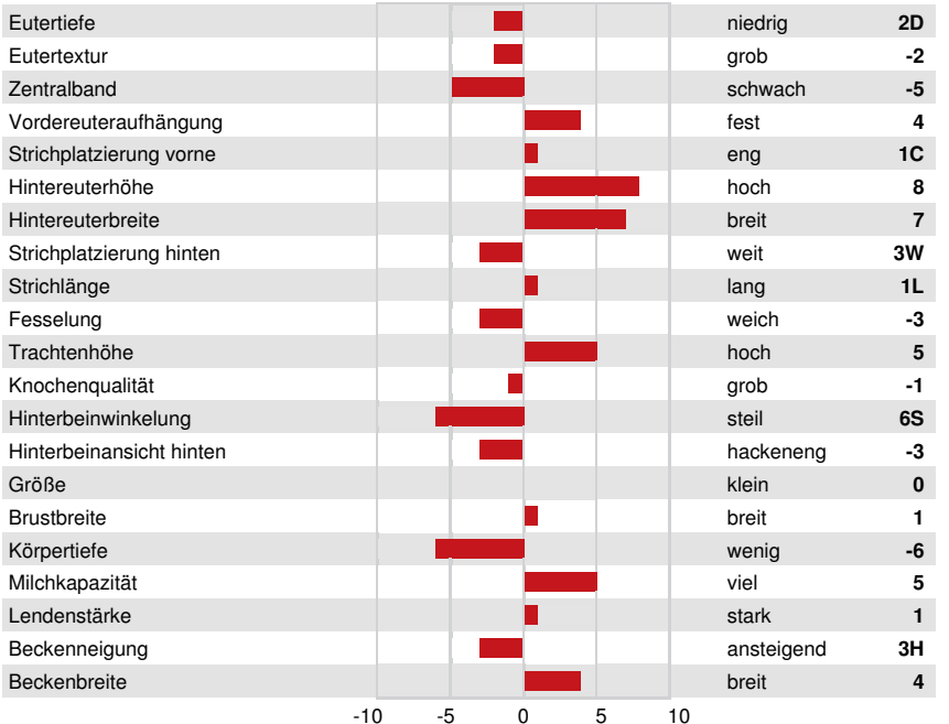
GAH PAOLA DAUGHTER