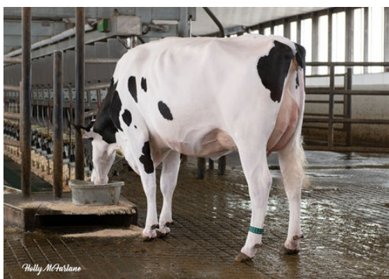
STANTONS COCKPIT BRANDY