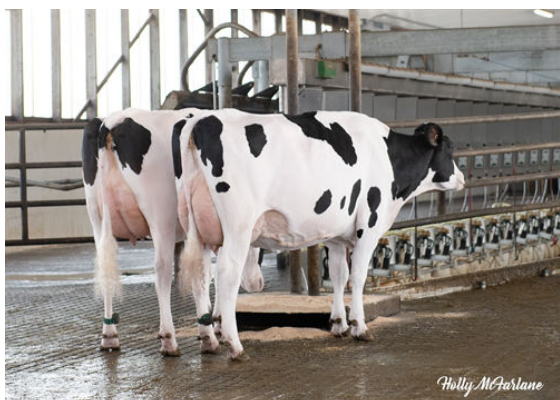
COCKPIT DAUGHTER GROUP

L TO R - STANTONS COCKPIT BRANDY, STANTONS COCKPIT PEPPERMINT