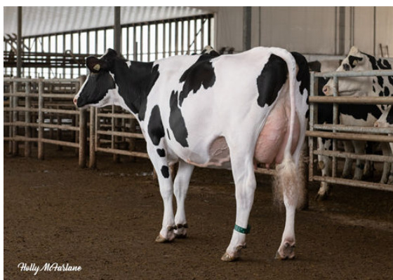
STANTONS COCKPIT PEPPERMINT

L TO R - STANTONS COCKPIT BRANDY, STANTONS COCKPIT PEPPERMINT