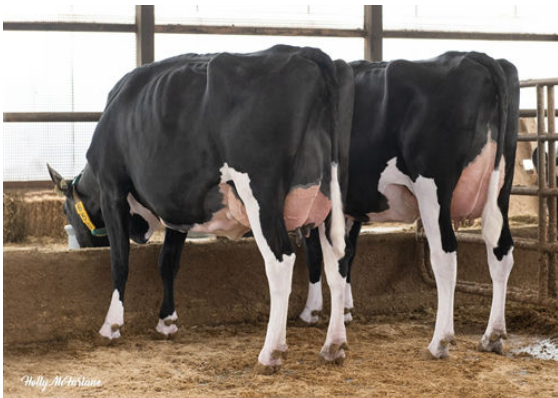
RIVER DAUGHTER GROUP L to R - ARMSTRONG MANOR IVY 4650, ARMSTRONG MANOR IDONIE 4683