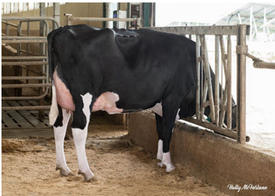
ARMSTRONG MANOR IDONIE 4683 DAUGHTER