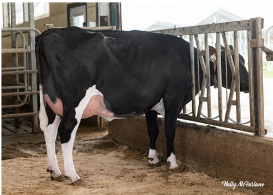
ARMSTRONG MANOR IVY 4650 DAUGHTER