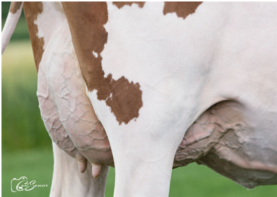
MICHERET SAUGE ZOOM RED DAUGHTER