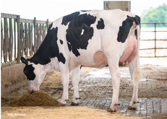
PROGENESIS RANGER ANTHEM DAUGHTER