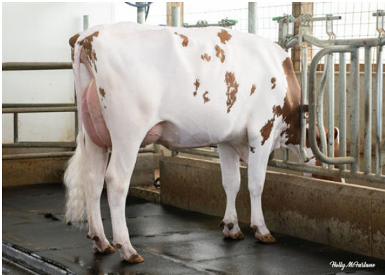
NORTH-POLLED RANGER MIRACLE P DAUGHTER