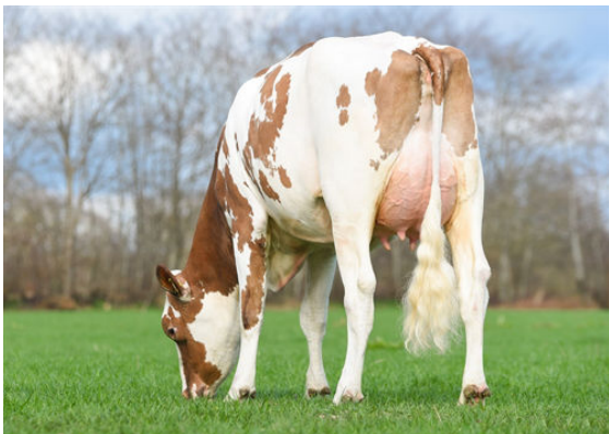
GIH LITTLE STAR DAUGHTER