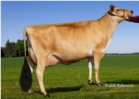
PROGENESIS MADISON- GRANDDAM

VIERRA PRETENDERS PROGENESIS DOROTHY VG-84%-2YR-USA VIERRA TENPENNY PROGENESIS MADISON EX-90%-3YR-USA JX RIVER VALLEY CHIEF {6} RACHELLES VICEROY LOUISE VG-88%-6YR-USA