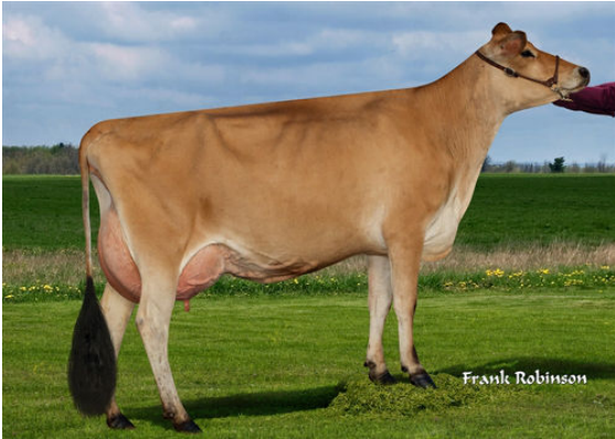
JX LUCKY HILL WHISKEY {6} DAM