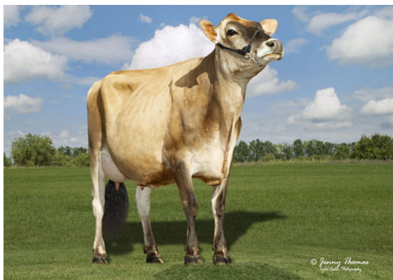
JX PROGENESIS BNCROFT DEJA {6} DAM