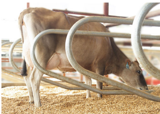
JX PROGENESIS BNCROFT DEJA {6} DAM