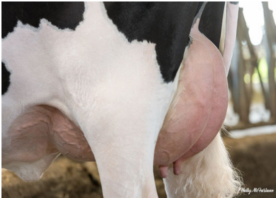
WALNUTLAWN RANGER BRAVA DAM