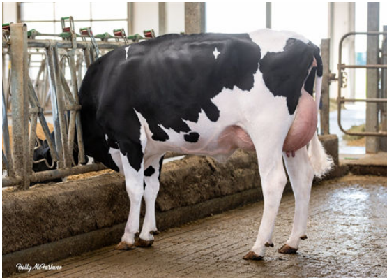
WALNUTLAWN RANGER BRAVA DAM