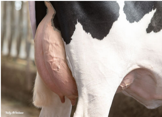
WALNUTLAWN RANGER BRANDY DAM