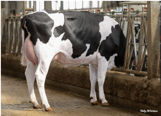
WALNUTLAWN RANGER BRANDY DAM