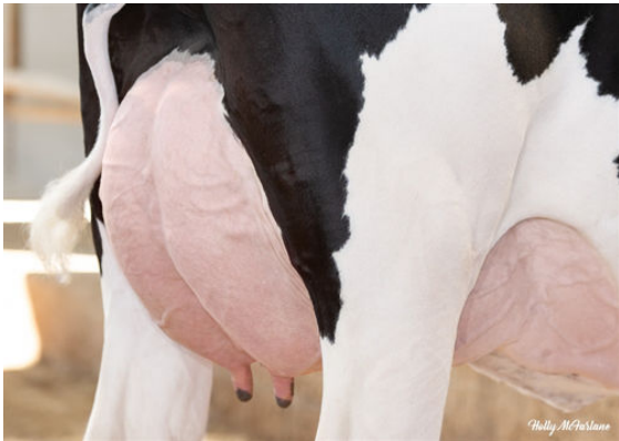
PROGENESIS GRAZIANO JAZMATIC DAM