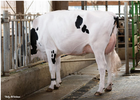
WESTCOAST ASHBY DOCA DAM