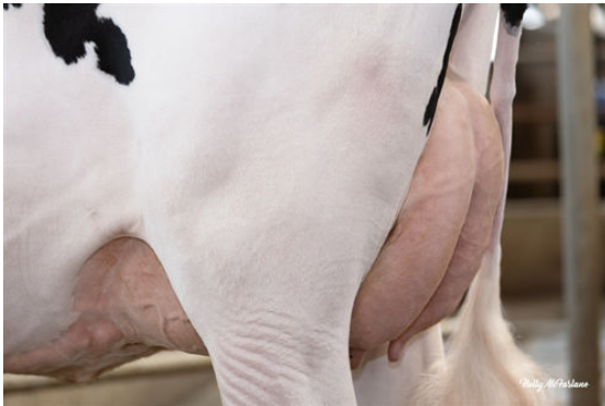
WESTCOAST ASHBY DOCA DAM