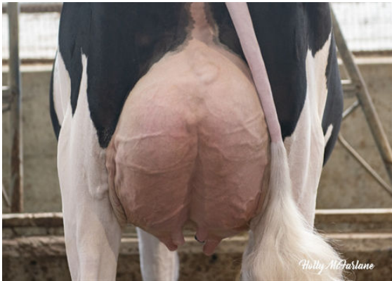
PROGENESIS MONTB ENERGIZER P DAM