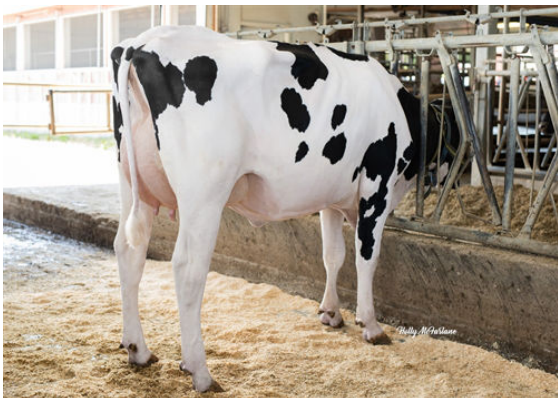
PROGENESIS FABULOUS PEARL GRANDDAM