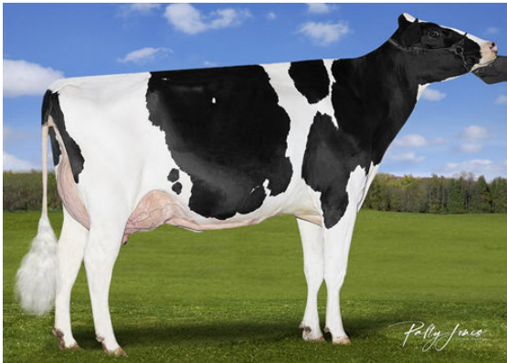
VOGUE YODA SALLY-PP DAM