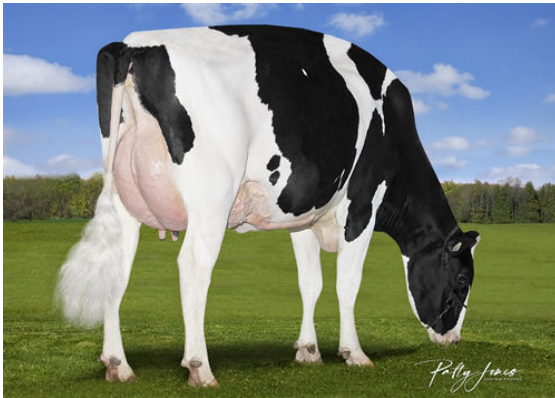
VOGUE YODA SALLY-PP DAM