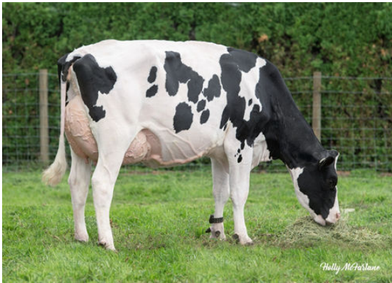
VOGUE LIMELIGHT ANGEL EYES-PP DAM