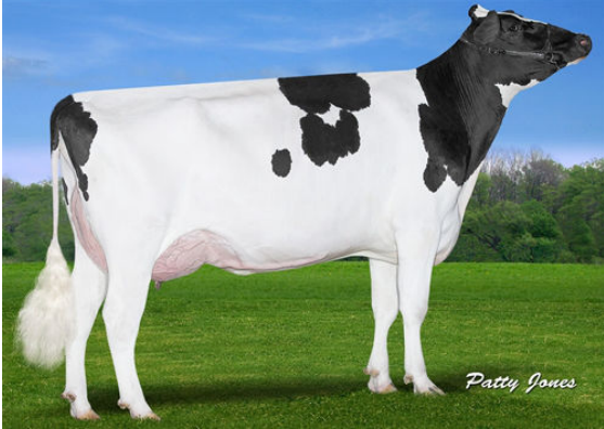
CLAYNOOK FABBY SILVER FOURTH DAM