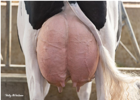
PROGENESIS EINSTEIN RUDY DAM