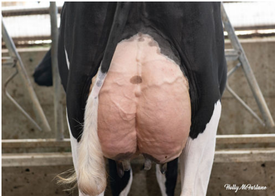
PROGENESIS FASTBALL PRISSY DAM