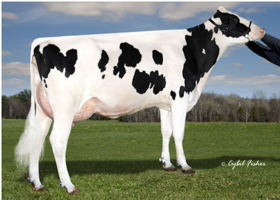
MAIN-DRAG RUBICON EMAIL FOURTH DAM