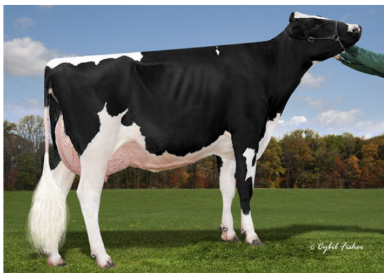
COOKIECUTTER DTA HABITAN