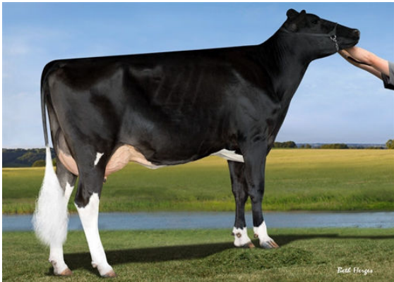
IHG WINNEY JEROD 55380 FOURTH DAM