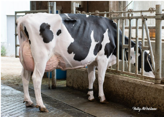
BRANDT-VIEW ACHIEVER ARAXIE DAM