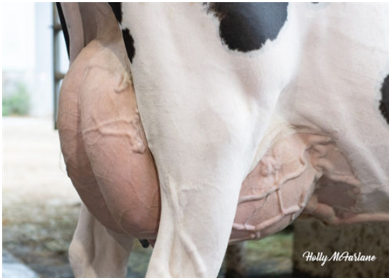
BRANDT-VIEW ACHIEVER ARAXIE DAM