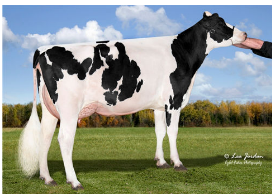
COOKIECUTTER SLM HOPLITE