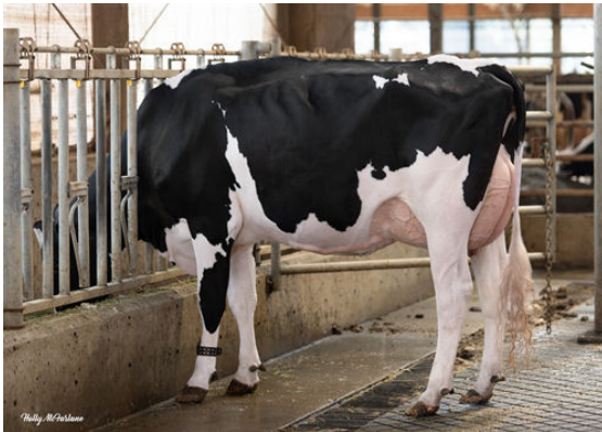
PROGENESIS WC 13179 DAUGHTER