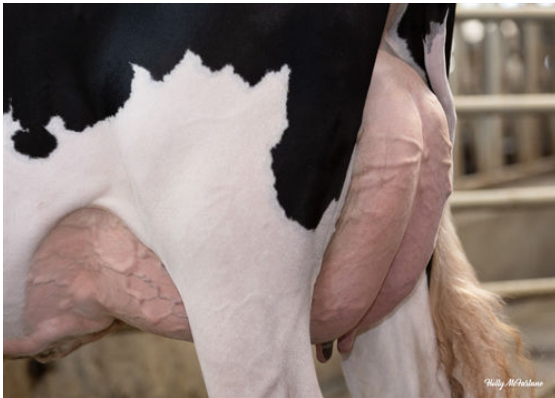
PROGENESIS WC 13179 DAUGHTER