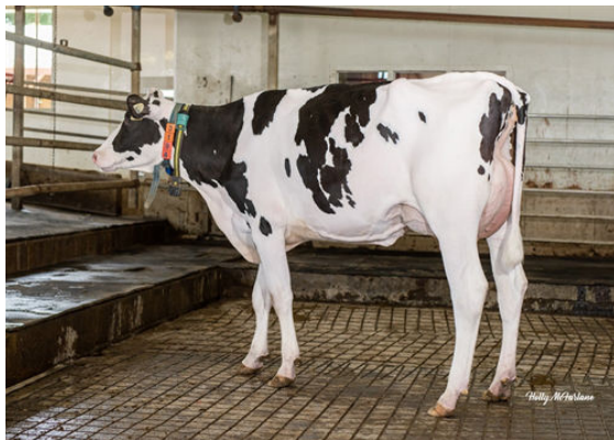
PROGENESIS FABULOUS KINDLE DAM