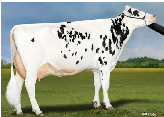
BOMAZ DELTA 6790 GRANDDAM