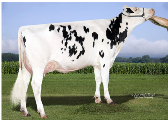
BOMAZ NUMERO UNO 5904 THIRD DAM