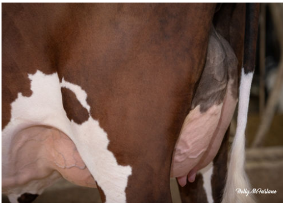
PROGENESIS CHAMPION TIANNA DAUGHTER