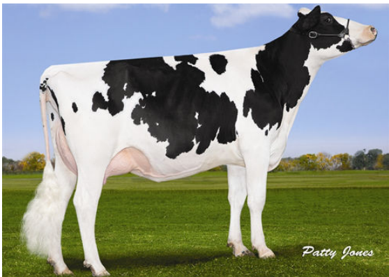
OCONNORS LAST HOPE GRANDDAM