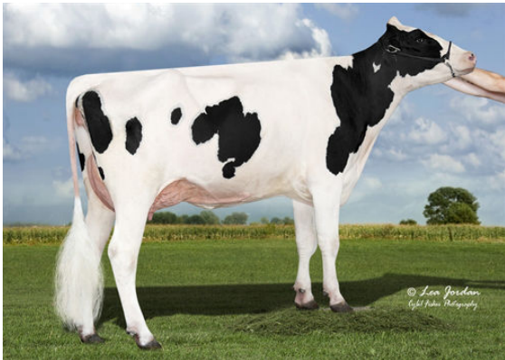
SCENERY-VIEW CRYSTAL DAM