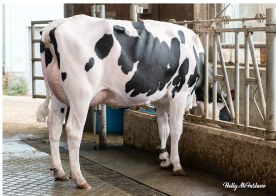
PROGENESIS MANHATTAN PIPER DAUGHTER