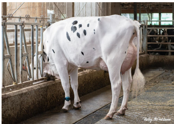
WESTCOAST MNHTTN ABYSS 11917 DAUGHTER

PROGENESIS POSITIVE PROGENESIS GUARANTEE MATRIX WESTCOAST GUARANTEE PROGENESIS DUKE MELEE VG-87-5YR-USA 8* S-S-I MONTROSS DUKE PEAK BOMBERO MAXIMA VG-87-6YR-USA DOM