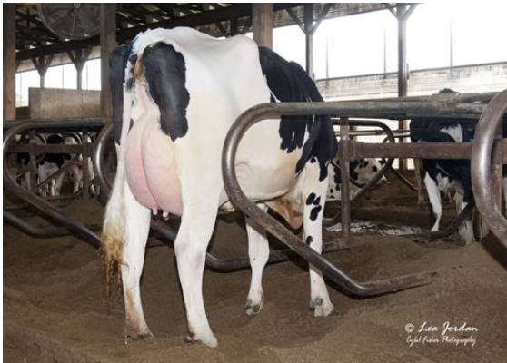
OCD BURLEY FRANCES 41330 DAM