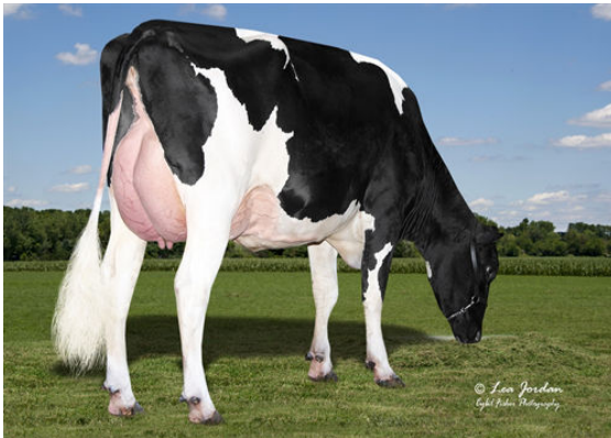
AOT ZASBERILLA HAKE DAUGHTER