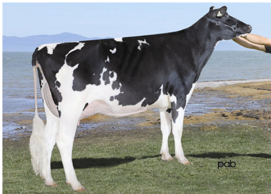
WABASH-WAY-I SHOTTLE EMBER FIFTH DAM