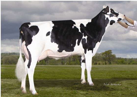
RICHMOND-FD S BARBARA THIRD DAM