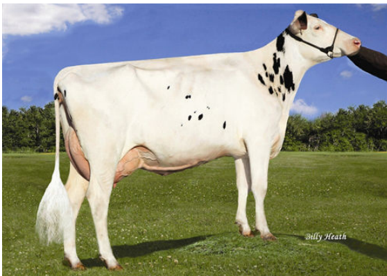
RICHMOND-FD BARBIE FOURTH DAM