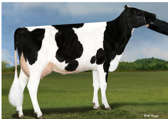
TRIPLECROWN DELTA 26 GRANDDAM