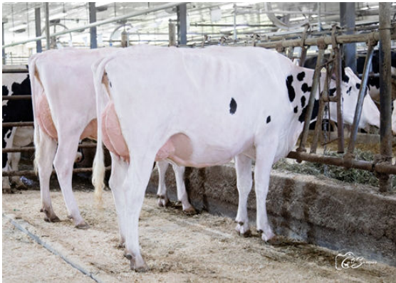
KNOWHOW DAUGHTER GROUP L TO R - CAMPAGNA KNOWHOW RUBY, CAMPAGNA KNOWHOW BARBARA