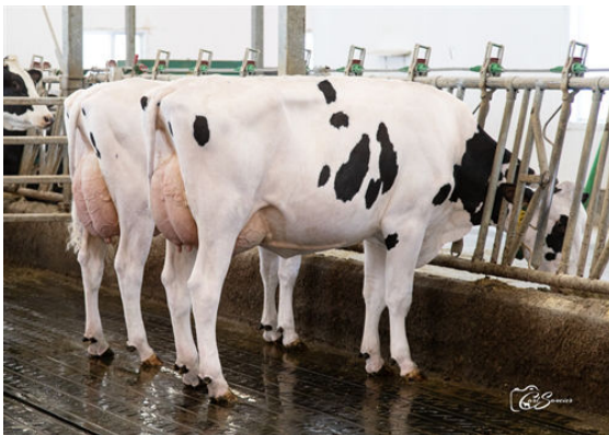
KNOWHOW DAUGHTER GROUP L TO R - LEO THE KNOWHOW DEBBY, LEO THE KNOWHOW GRAPHITE