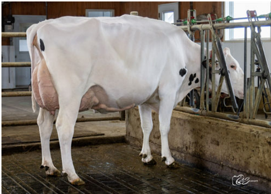
GERLUDA KNOWHOW ELSINIO DAUGHTER