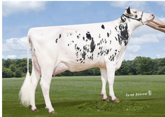
MATCREST BOOKEM COOKIE GRANDDAM