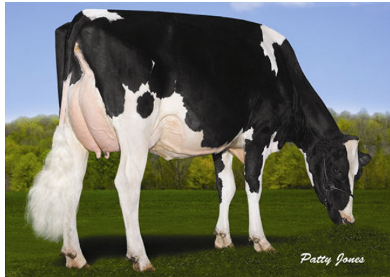
VELTHUIS SG MOM ALESIA Granddam