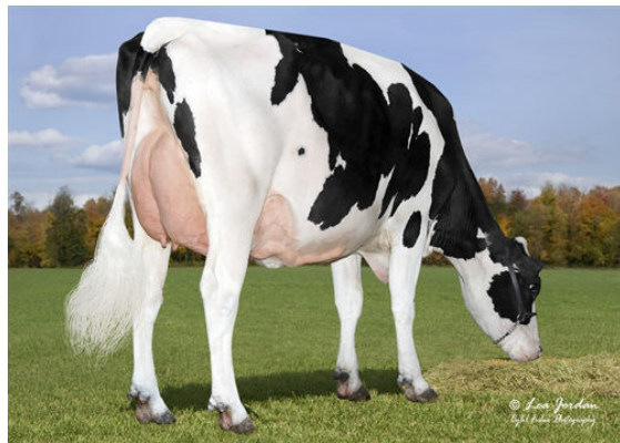
BLASER GRAM 5421