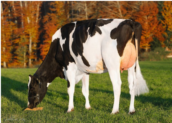
OUR-FAVOURITE SIDEKICK PAMELA DAM