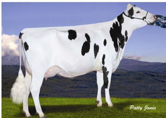
GILLETTE GARRETT LOOKAS FOURTH DAM